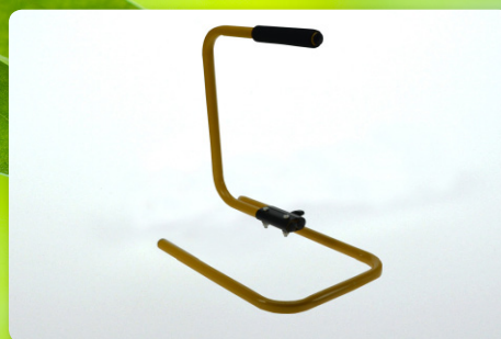
■ Tragegestell für 10W Flutlichtstrahler